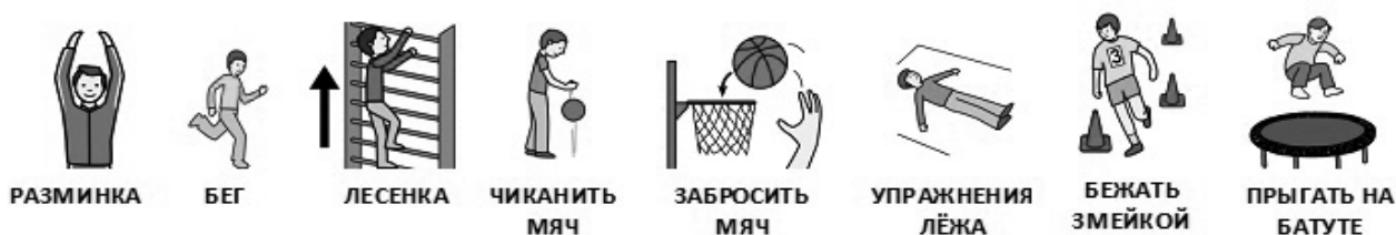
Рис. 3. Пример расписаний занятий музыкой, рисованием и физкультурой.

Важным аспектом внедрения визуального расписания стало его использование при освоении детьми бытовых навыков. Данный вид расписания достаточно прост для понимания детьми, так как представляет собой логическую последовательность событий и конкретные предметы, определяющие контекст ситуации. Тем не менее, по способу его освоения произошло усложнение, так как предыдущие виды расписания ребенок осваивал на индивидуальных занятиях с педагогами, а расписание бытовых действий дети осваивали в группе сверстников.