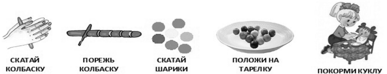
Рис. 5. Пример визуального расписания для сопровождения игровой деятельности.