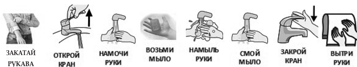
Рис. 4. Визуальное расписание для формирования навыка самостоятельного мытья рук.

Например, визуальное расписание, отображающее последовательность действий во время процедуры мытья рук, является алгоритмом одной деятельности (см. рис. 4). Такое расписание требует дополнительной полоски внизу, чтобы на нее ребенок перемещал карточки, отображающие выполненную деятельность (удобно использовать съемные карточки на липучках). Данное условие облегчает ребенку понимание того, что он уже сделал, и каким должен быть его следующий шаг. То же самое касается процесса одевания: последовательность одевания очень важна, при этом ребенок не всегда удерживает в голове, что он уже надел, и может продолжать искать эти предметы в шкафу. И расписание помогает ребенку самостоятельно одеваться и меньше тратить времени на этот процесс.