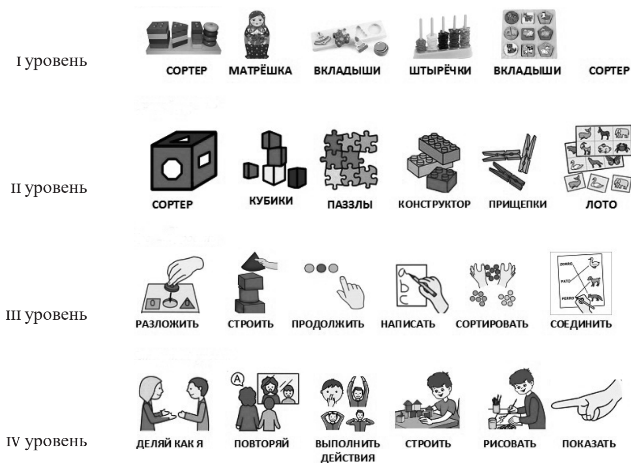
Рис. 1. Уровни сложности визуального расписания для дефектологического занятия.

дефициты визуального восприятия ребенка, чтобы далее использовать тот визуальный материал, которого требуют жизненные и учебные ситуации, не думая о его сложности (см. рис. 1).